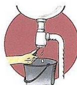
Peta loss eventuellt avfall som fastnat.