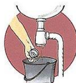
Öppna vattenläset. Ställ en hink under, så att inte vatten och smuts rinner ut på golvet.